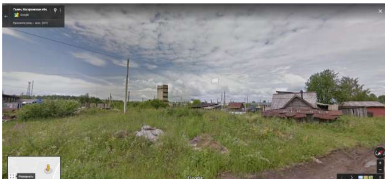
Фотография земельного участка по ул. Металлистов